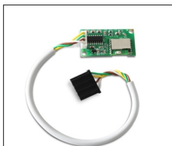
Interface Bluetooth intégrée