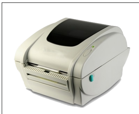
Etiquetteuse thermique directe LP542