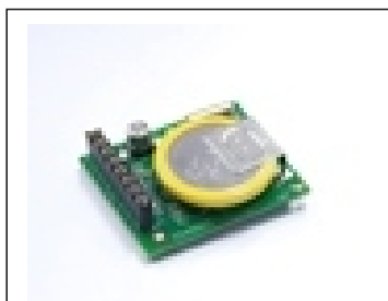
Horodateur pour imprimer/visualisation de la date et de l'heure